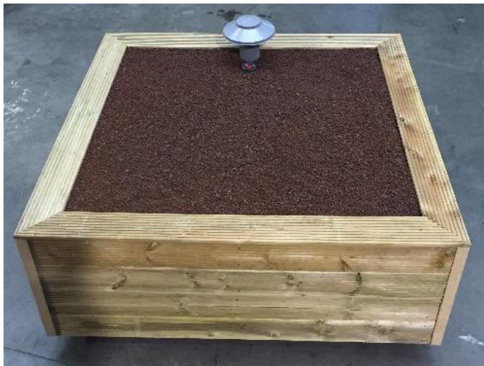
3 BORA-CLEAN FILTER 4.600 LITER LxBxH: 2.040 x 2.040 x 1.200 mm