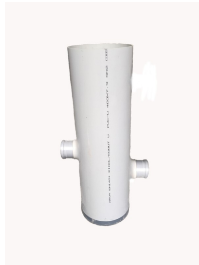
4 STAALNAMEPUT LxBxH: 315 x 315 x 1.620 mm