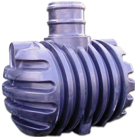
1 VOORBEZINKER 6.000 LITER LxBxH: 2.400 x 2.070 x 2.500 mm