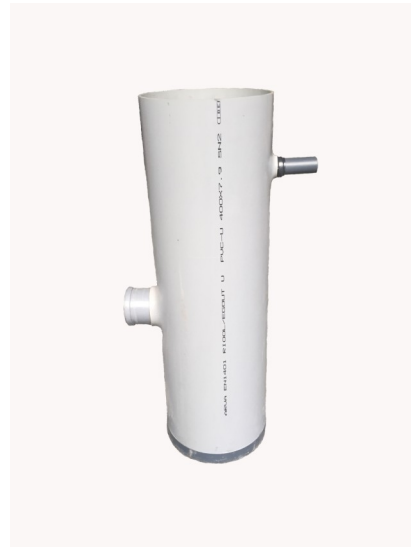
2 POMPPUT 130 LITER LxBxH: 400 x 400 x 1.300 mm